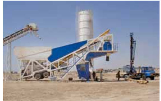
77 İNŞAAT - AFGANİSTAN / 60M