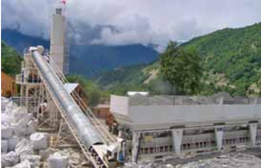
ZIMO - GÜRCİSTAN / 60W