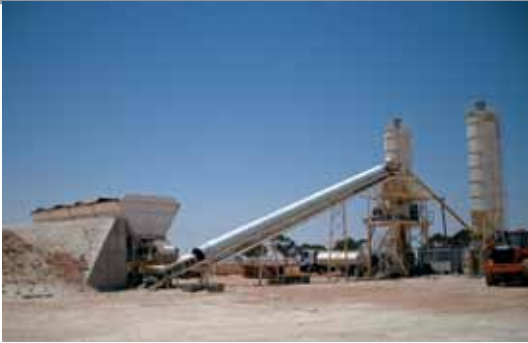
NATIONAL DEV. CONS. CO - LIBYA / 100W