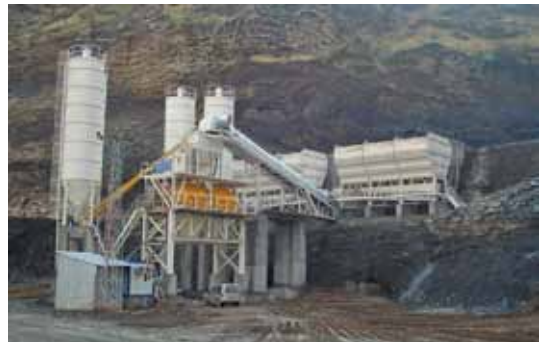
İLCİ - SILOP / 180W