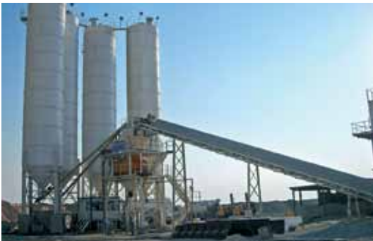
REDCO - KATAR / 120W