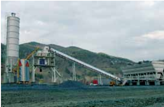
YÜKSEL İNŞAAT - KAHRAMANMARAŞ / 100W