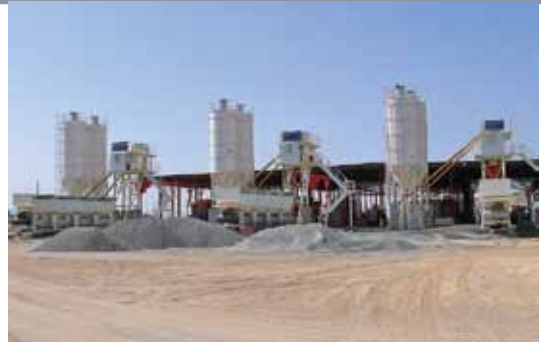
ALAWI TUNSI ESTABLISHMENT SUUDI ARABİSTAN / 3 x 30WS