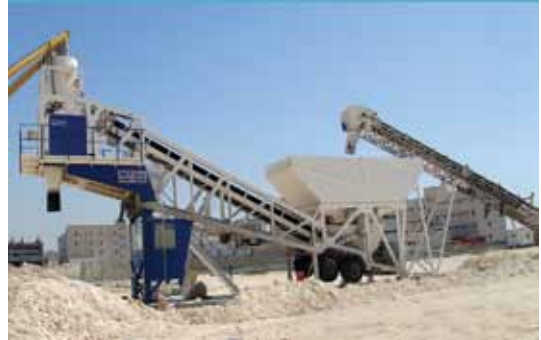
DREAM GROUP BAHREYN / 100M